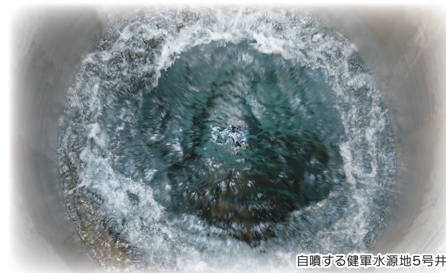
自噴する健康水源地5号井

九州の中央に位置し、今なお活動を続ける雄大な阿蘇山。その西麓に広がる地層は、数万年以上前、噴火の際に噴出した火山灰や溶岩が幾重にも堆積したものです。これらの地層が自然のフィルターとなって地下を流れる水をろ過。たっぷり時間をかけて、ミネラルや炭酸ガスを含んだ良質な水へと変わっていきます。