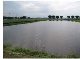
白川中流域での地下水かん養の様子

汚水処理率の向上を図るとともに、農業用集落排水や合併処理浄化槽等とも連携・役割分担することで、汚水をきれいに自然に還し、水環境・水循環を保全する。