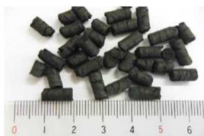
(左)下水汚泥固形燃料化施設と(右)燃料化物(炭化固形物)