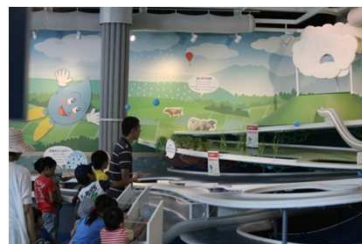
熊本市水の科学館