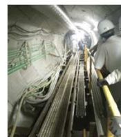
加勢川第6排水区雨水幹線シールド工事

加勢川第6排水区(東区若葉・秋津新町) ポンプ棟外溝工事 坪井川第3排水区 用地取得、調整池工事 等