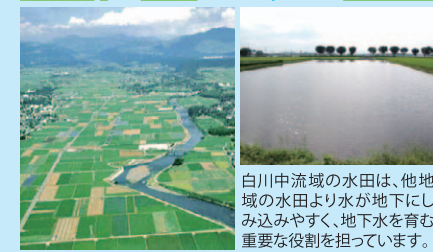
白川中流域の水田は、他地域の水田より水が地下にしみ込みやすく、地下水を育む重要な役割を担っています。