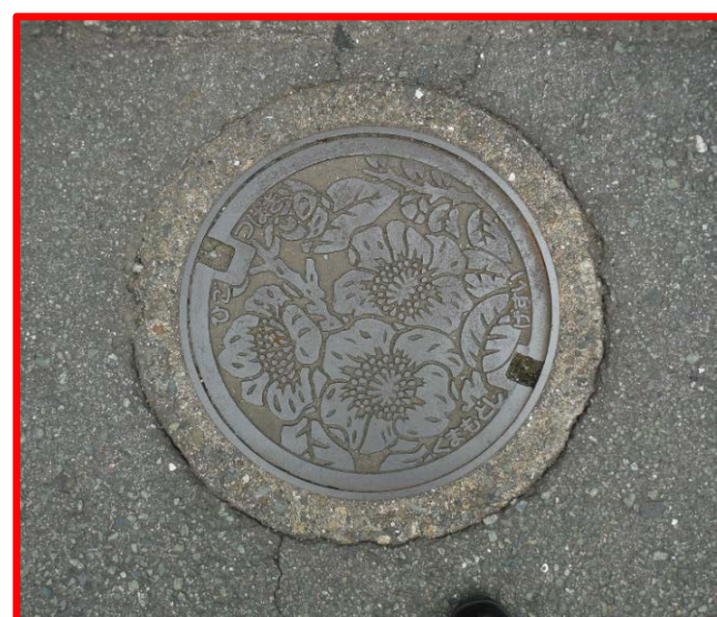
コンクリート製公共汚水枡 (直径50cm 鉄ふた)