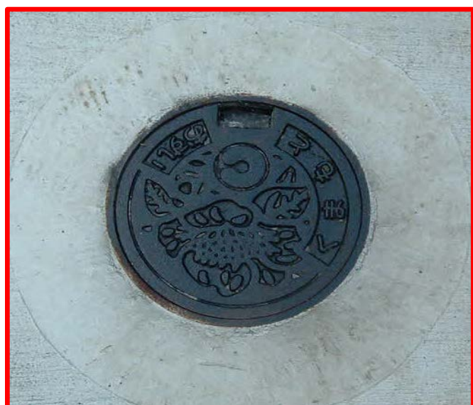
保護蓋製公共汚水枡 (直径25cm 鉄ふた)

官民境界から約1m以内に設置しております。 また、ふたには熊本市の市章『C』が表記されております。