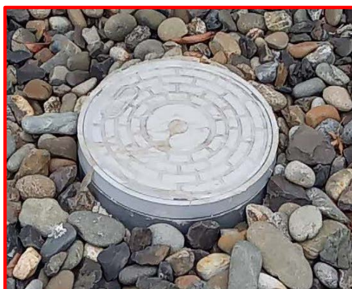
塩ビ製公共汚水枡 (直径20cm 塩ビふた)