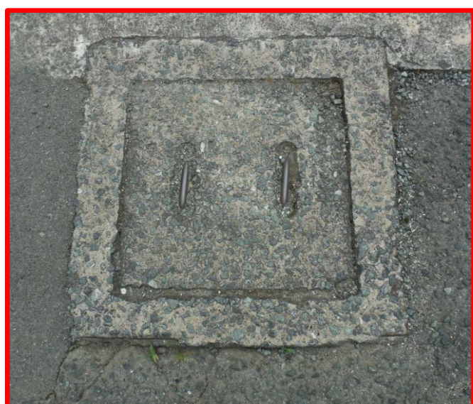
コンクリート製公共汚水枡 (約65cm×65cm コンクリートふた)