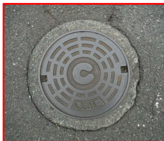
コンクリート製公共汚水枡 (直径50cm 鉄ふた)