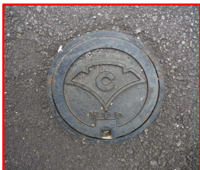
コンクリート製公共汚水枡 (直径17cm 鉄ふた)