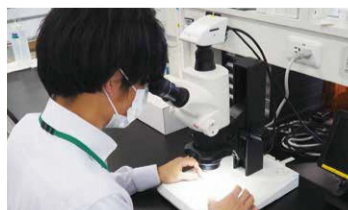
顕微鏡での結果確認