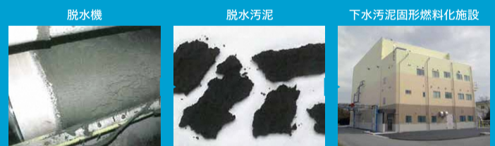
下水汚泥の有効利用例

脱水汚泥は、これまで安定化・減量化のため、南部浄化センターの焼却炉で全量焼却してきましたが、循環型社会形成・地球温暖化防止の観点から、汚泥の有効利用に積極的に取り組み、平成20年度からは一部をセメントやコンポスト(肥料)の原料として活用し、平成25年度からは残りを固形燃料化することでリサイクル率100%を達成しています。