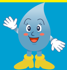
熊本市上下水道局 キャラクター ウォックくん

皆さまに納めていただく下水道使用料は、ご家庭や事業所などから排出された汚水を、きれいな水にして河川等に放流するためのや下水道管の清掃・維持管理などに充てられています。