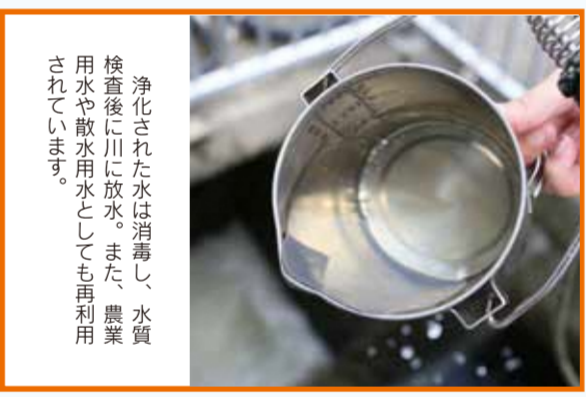
浄化された水は消毒し、水質検査後に川に放水。また、農業用水や散水用水としても再利用されています。