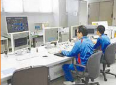
浄化センターでは、下水をきれい処理した後、消毒して海や川に還す水処理と、その処理過程で取り除かれた汚泥を減量化・安定化する汚泥処理を24時間休みなく行っています。