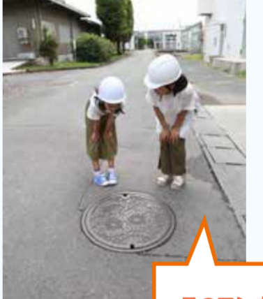
このマンホールの下を下水が流れているんだね