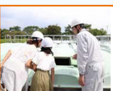
センターに集まった下水は、「最初沈殿池」で汚れを沈めさせます。うわあ!黒くて下水の匂いがする!!

微生物たちが大活躍 浄化センターでは、微生物や菌の働きで、汚れを沈め、上澄み水を消毒し、海や川へ流します。また、汚れ(汚泥)を処理するときにも、別の微生物や菌が活躍しています。