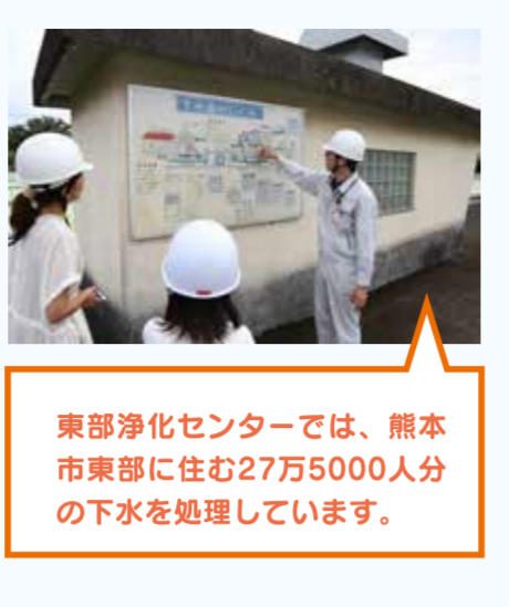
東部浄化センターでは、熊本市東部に住む27万5000人分の下水を処理しています。