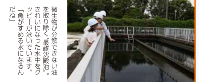
微生物が分解できない油を取り除く最終沈殿池。きれいになった水中をラッピーが泳いでいます。「魚がすめる水になるんだね」