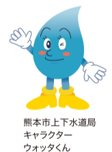
熊本市上下水道局 キャラクター ウォータくん