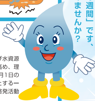
熊本市上下水道局 キャラクター ウオッタくん

8月1日から8月7日までは「水の週間」です、この機会に「水」について考えてみませんか？