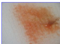
【写真①】洗面所のピンクの着色を拭き取ったガーゼ