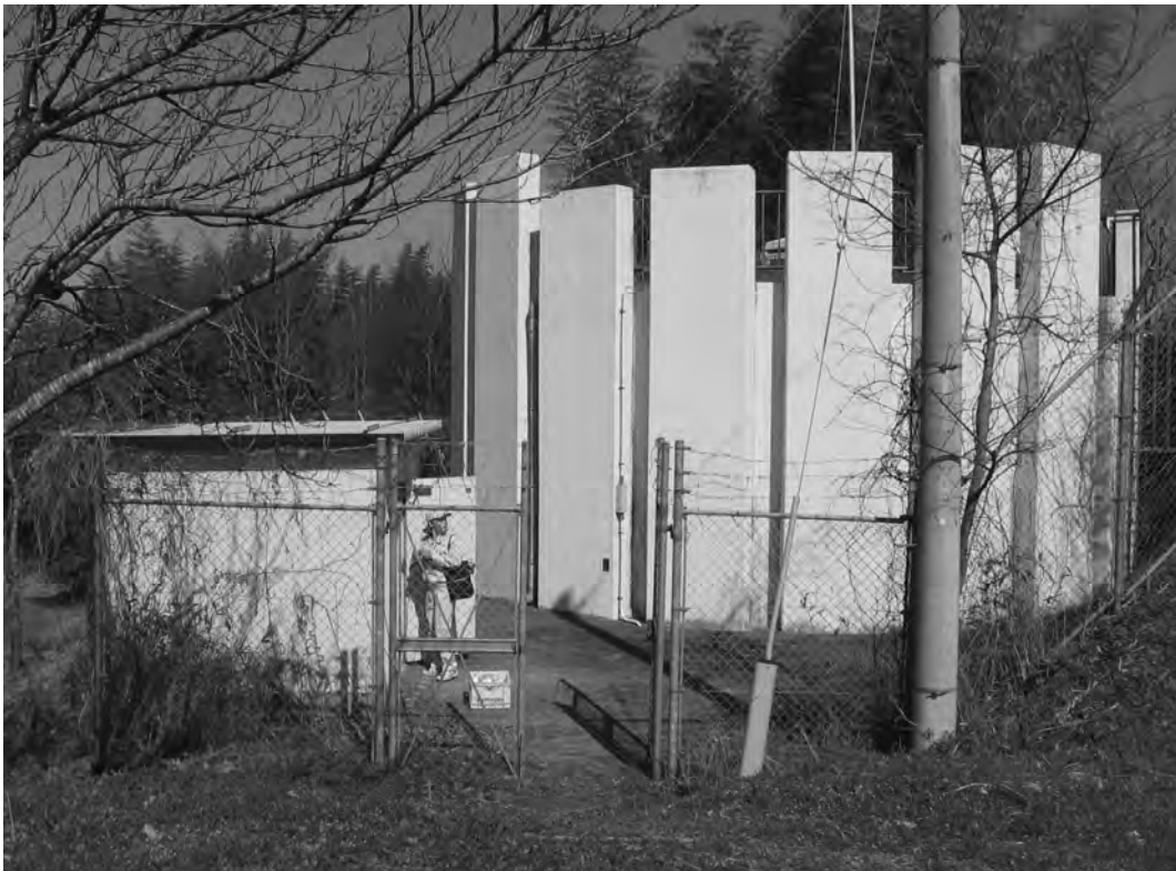
工業用水道配水池