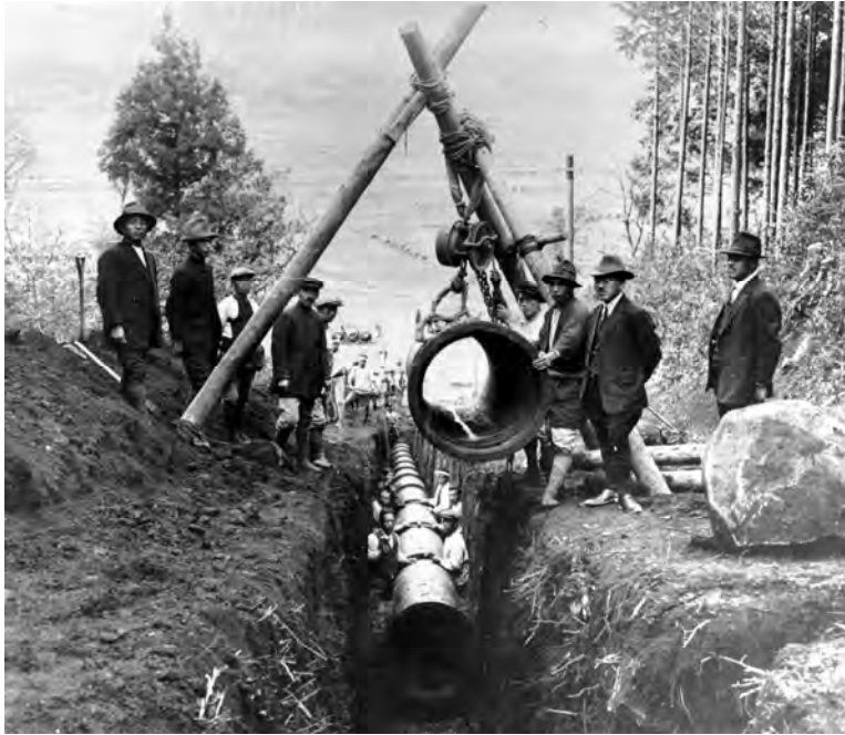
八景水谷送水管布設工事（大正期）