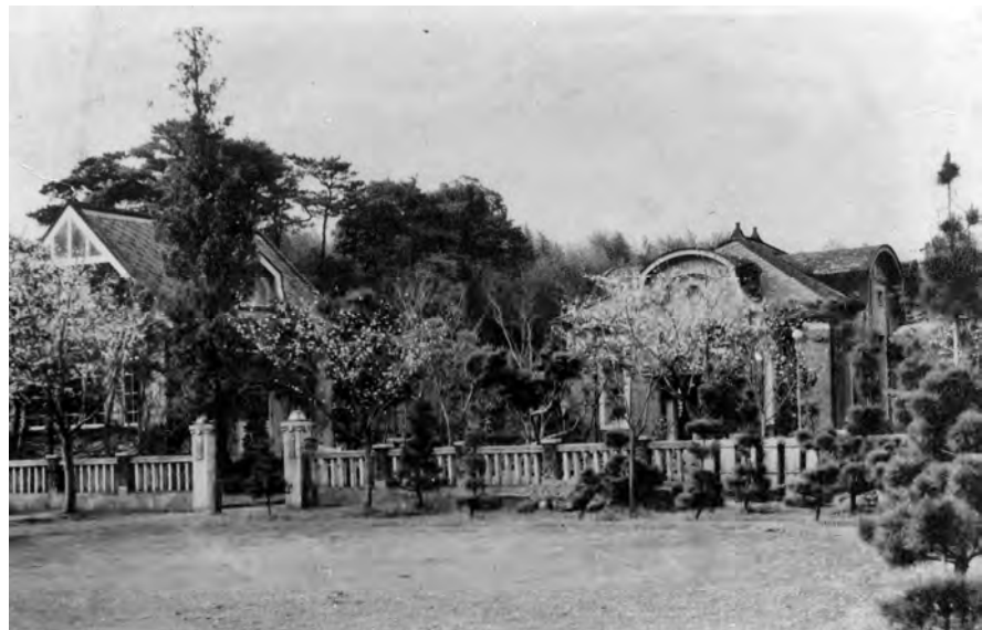
八景水谷送水場（大正期）