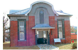
熊本市水道記念館