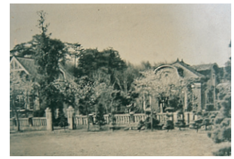
創設当時の八景水谷水源