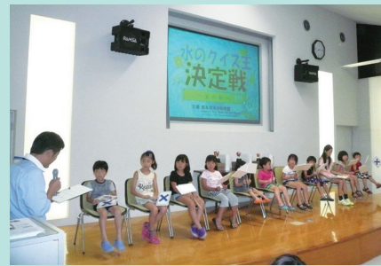
「水のクイズ王決定戦」にて(水の科学館)