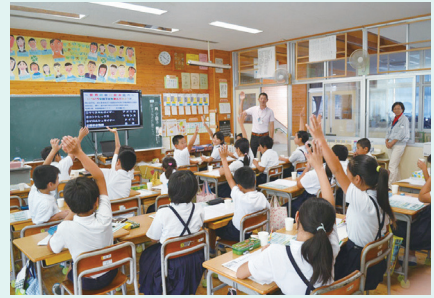
校区の上下水道について質問する生徒たち (水の循環出前教室)

上下水道のしくみ、水循環について理解を深めてもらうため、上下水道施設の「施設見学」、小学校などへの訪問授業「出前教室」を行っています。