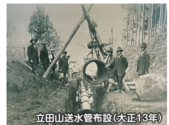
立田山送水管布設(大正13年)