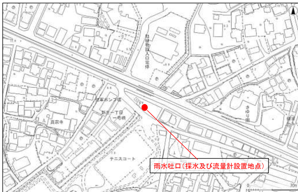
雨水吐口 (※足場が必要)