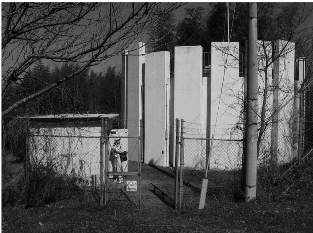
工業用水道配水池