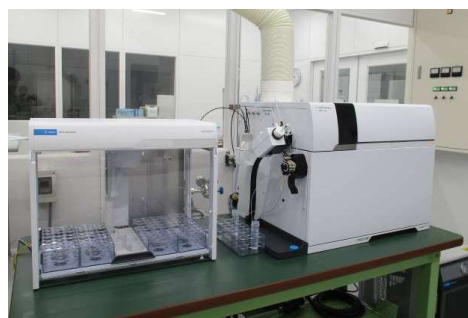
誘導結合プラズマ質量分析装置 (ICP-MS)