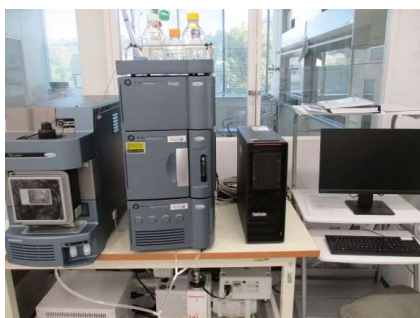
高速液体クロマトグラフトンデム型質量分析装置 (LC-MS/MS)