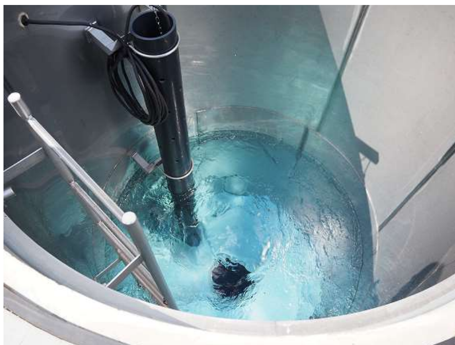
健軍水源地取水井内部