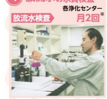
※処理状況確認の検査は常に実施しています。