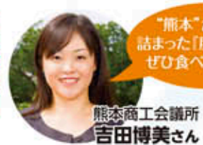
「熊本」がいったい 詰まった「肥後すずぶ」を ぜひ食べてください!

私たちのふるさと・熊本には、豊かな水があるからこそ 続く伝統や新しく生まれるモノがあります。今回は、水助くんと水菜ちゃんが熊本の新たな食として注目の「肥後すずぶ」なるものを耳にしました。さっそく、「肥後すずぶ」を企画している熊本商工会議所へ調査開始です!