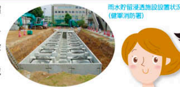
雨水貯留浸透施設設置状況 (健軍消防署)

近年のゲリラ豪雨や都市化の進展に伴い、雨水処理施設の能力を超えた雨水流出量の増大により、市内各所で浸水被害が発生しています。その対策のひとつとして、健軍駐屯地など公共施設が数多くある東町地区(約130ha)では、市が所有する6つの施設に、雨水貯留浸透施設(約2000トン)を設置しています。今後も、他の施設管理者の協力も得ながら、下流域の浸水被害軽減に向けて取り組んでいきます。