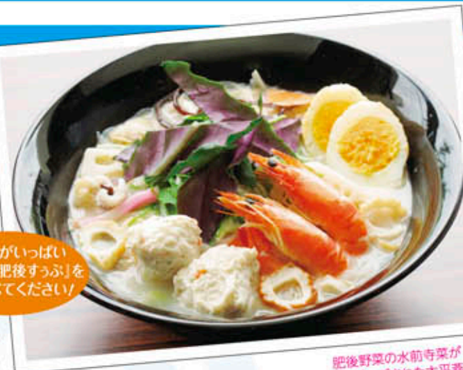
肥後野菜の水前寺菜が トッピングされた太平羹